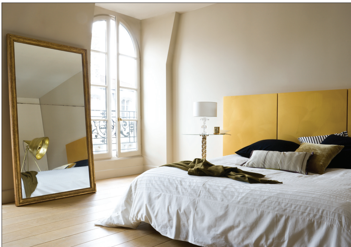
Tête de lit : Jaïpur Bombay - Murs : Mat 78 Hydroplus 90-909 - Plafonds : Covryl Mat